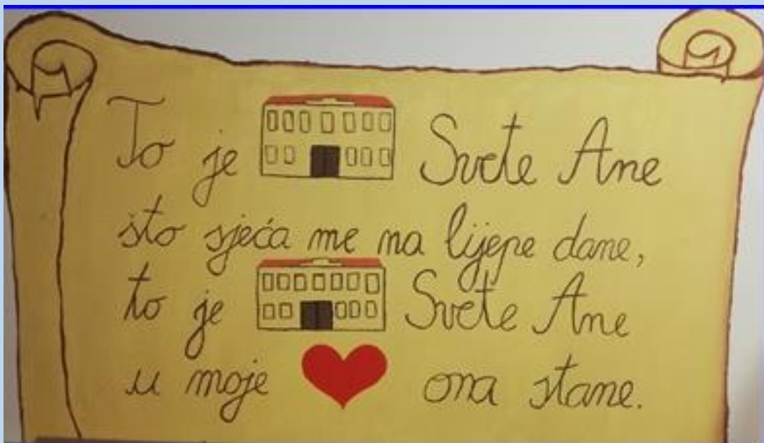
Osnovna škole Svete Ane u Osijeku