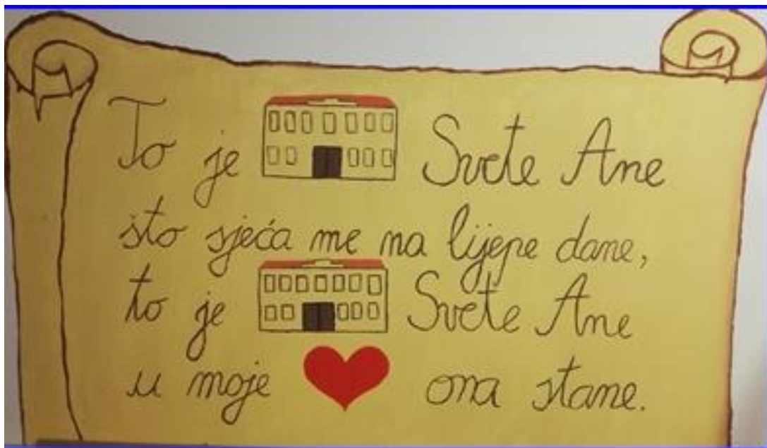
Osnovna škola Svete Ane u Osijeku